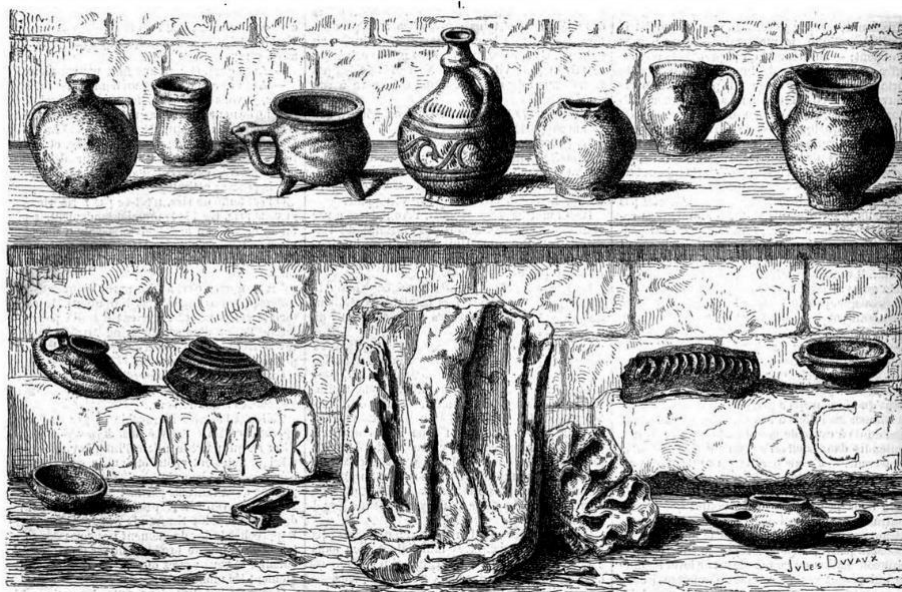
2. 3. 4. 5. 6. LES ARENES DE PARIS. — Objets trouvés dans les fouilles de la rue Monge.