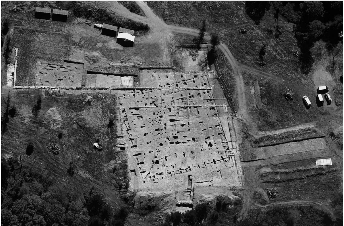
Le grand bâtiment public dit PCR 15, Bibracte, fouilles des universités de Bourgogne et de Franche-Comté, 2016