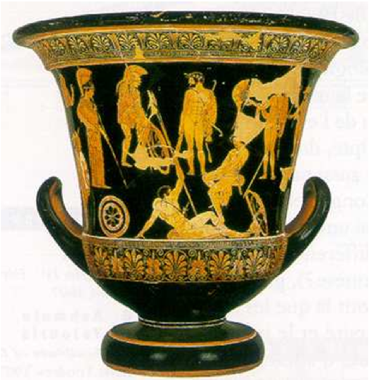
Paris, Musée du Louvre, n° inv. G341 ht. 54 cm Face B